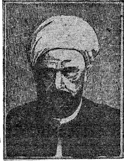
Musa Kâzım Efendi (“Asırlar Boyunca İstanbul” isimli eserden alınmıştır)